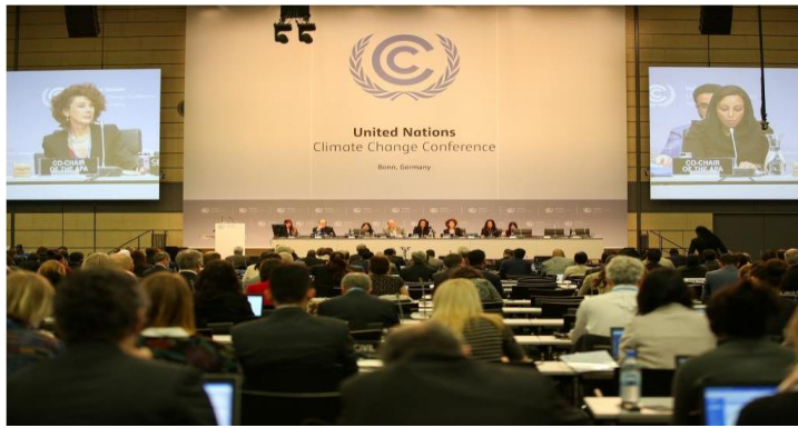
APA1.1 (Bonn; May 2016)