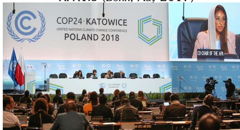
APA1.7 (COP24; December 2018)