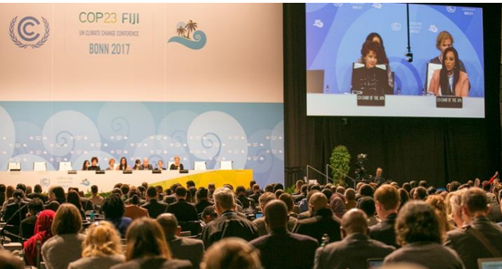
APA1.4 (COP23; November 2017)