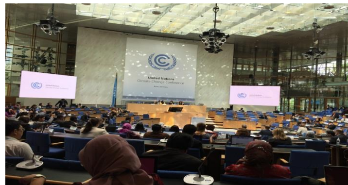
APA1.5 (Bonn; May 2017)