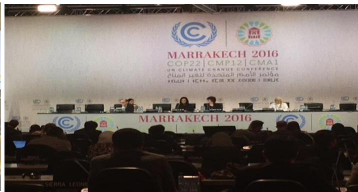
APA1.2 (COP22; December 2016)