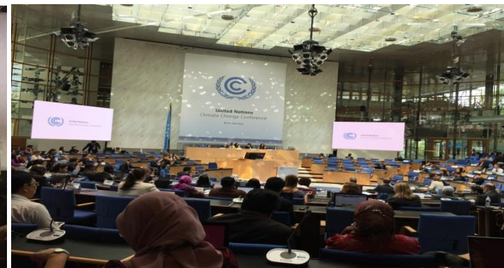
APA1.3 (Bonn; May 2017)