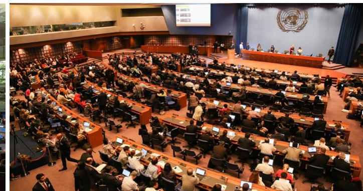
APA1.6 (Bangkok; September 2018)